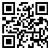
QR 1: Kompetencecenter for Læsning, Thisted Kommune